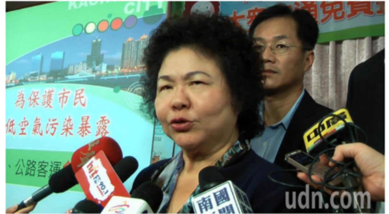
因應冬季空品不良，高雄市長陳菊宣布，從12月1日起連續3個月，實施大眾運輸免費搭乘措施。