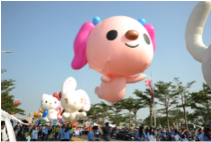
廣受大小朋友喜愛的「OPEN！大氣球遊行」又來了！不過為了配合活動進行將在夢時代周邊道路進行交通管制，包括時代大道、中華五路、中山三路南下慢車道、成功二路北上車道、舊凱旋四路，在12月12日至12月17日都有管制措施，請用路人特別注意相關訊息。