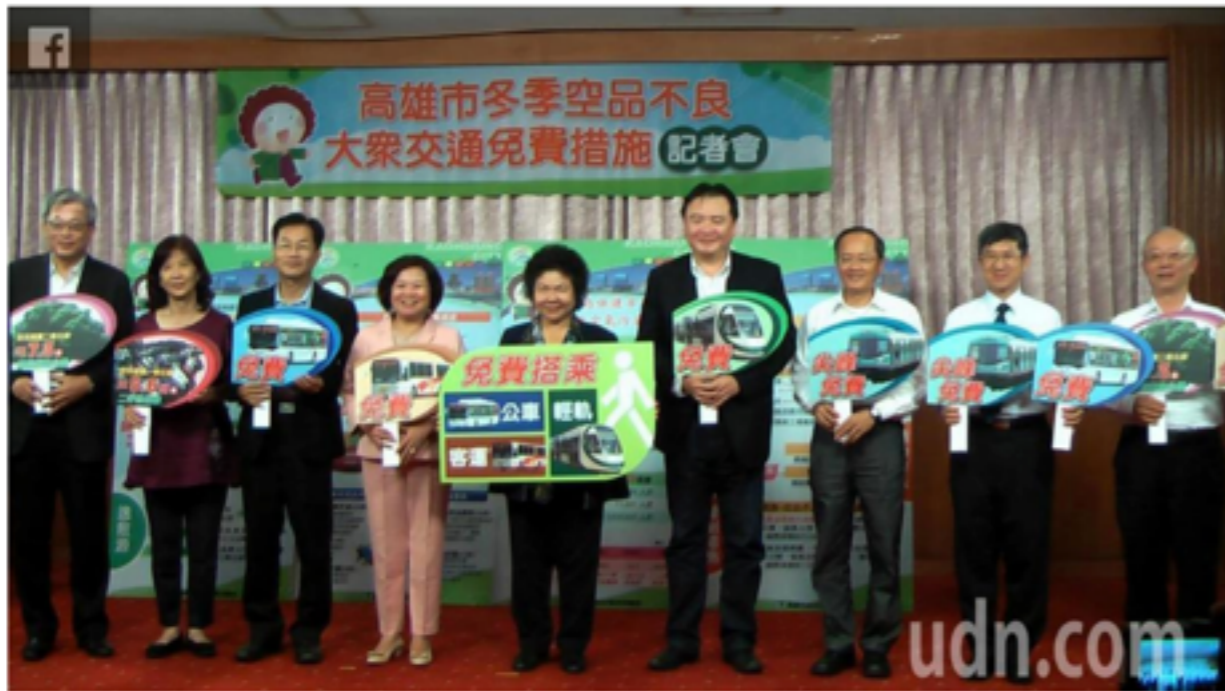
因應冬季空品不良，高雄市長陳菊宣布，從12月1日起連續3個月，實施大眾運輸免費搭乘措施。