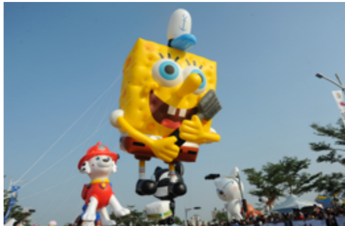
讓參加大氣球遊行、路跑市民，多利用大眾運輸。

廣受大小朋友喜愛的「OPEN！大氣球遊行」又來了！不過為了配合活動進行將在夢時代周邊道路進行交通管制，包括時代大道、中華五路、中山三路南下慢車道、成功二路北上車道、舊凱旋四路，在12月12日至12月17日都有管制措施，請用路人特別注意相關訊息。