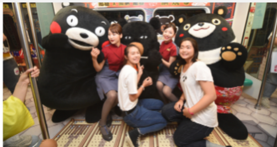
台灣知名吉祥物喔熊、高雄熊與日本阪人熊吉祥物熊本熊19日合體，齊聚高雄捷運紅線為高捷賣萌行銷彩繪車廂。

喔熊、高雄熊、熊本熊今天合體齊聚高雄捷運紅線為高捷賣萌行銷彩繪車廂，他們的超人氣，所到之處總是引起粉絲騷動追逐，彩繪列車今天起到6月18日行駛於捷運紅線。