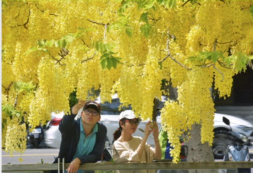
近距離觀賞阿勃勒

「阿勃勒」到處放閃 高雄盛夏湧現多處黃金雨 https://goo.gl/pUQBxu