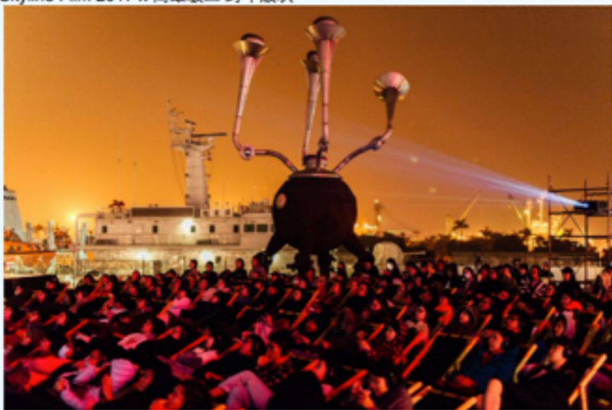
Skyline Film 2017 x 高雄駁二 跨年放映

在2017年跨年夜首次前進港都的Skyline Film屋頂電影院又再次回到駁二藝術特區啦!