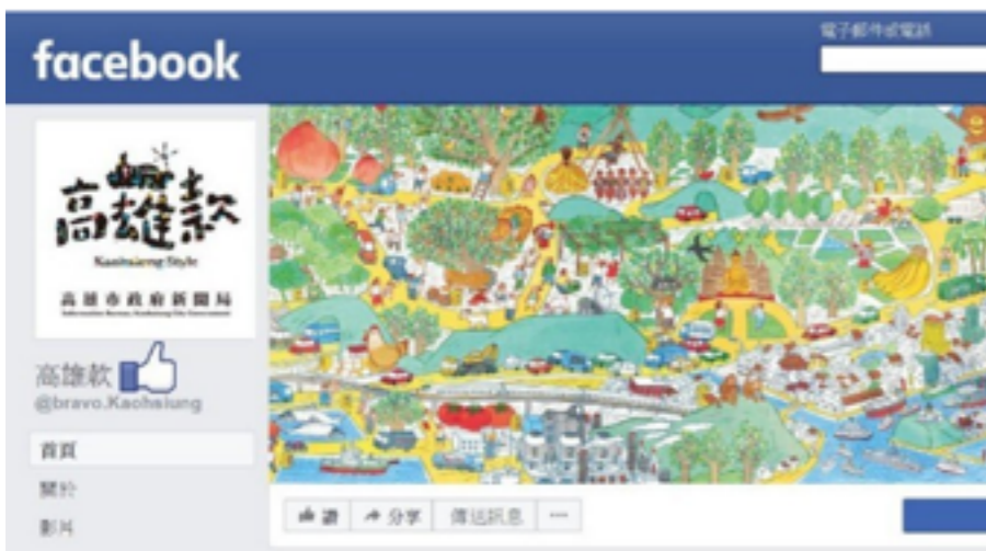
高市新聞局舉辦「好咖在高雄」臉書抽獎活動，即日起至14日在新聞局臉書粉絲專頁「高雄款」按讚，並分享高雄自家烘焙的咖啡館，就有機會獲得麗星郵輪香港3天2夜等獎。

分享高雄在地咖啡店 有機會得到麗星郵輪 https://goo.gl/qTvMbm