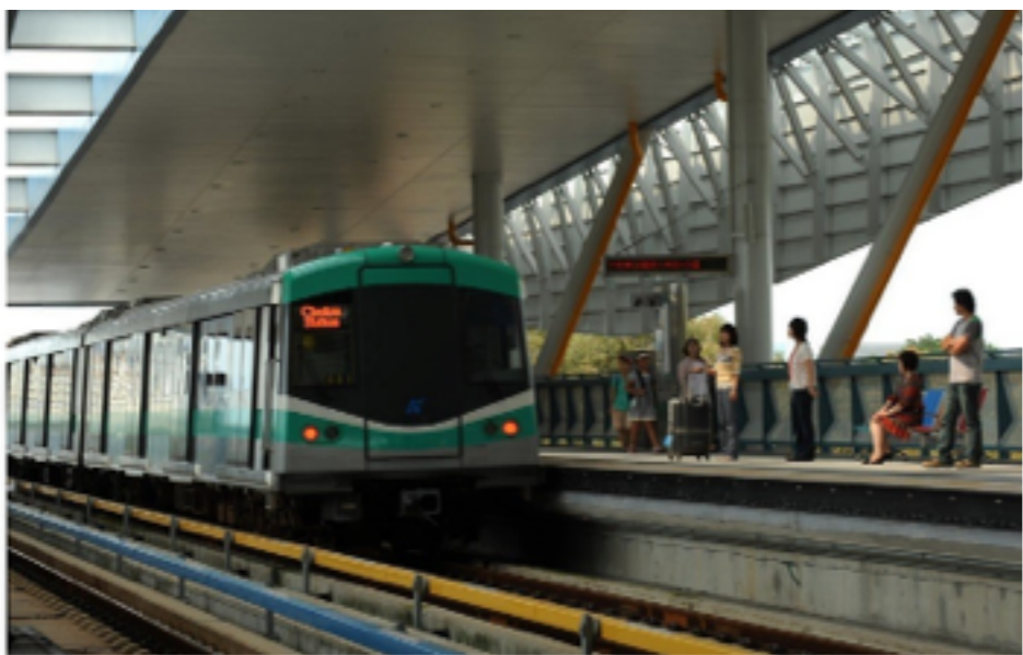
慶祝母親節，高雄捷運公司與市府合作，推出「免費婦女健康篩檢」、「免費視障按摩體驗」等活動。

慶祝母親節，高雄捷運公司與市府合作，推出「免費婦女健康篩檢」、「免費視障按摩體驗」等活動，只要在捷運站完成婦女健康篩檢，就可獲得50元超商禮券及捷運免費搭乘，還有免費視障按摩體驗可紓解筋骨。