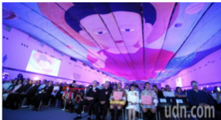
台灣首見世界最大穹頂佛畫現身高雄展覽館。

台灣首見！世界最大穹頂佛畫 現身高雄展覽館 https://goo.gl/AEyv2H