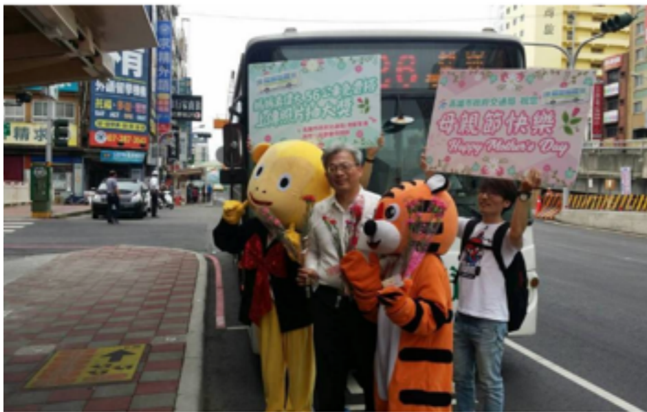
母親節，媽媽們12、13日搭高市56路公車到高雄壽山動物園玩，搭車、入園都免費。圖／高市交通局提供

慶祝母親節，高市交通局與壽山動物園、港都客運合推優惠，只要5月底前與媽媽搭公車拍照上傳，就可抽住宿券、電影票及福袋等；另12、13日，媽媽搭56路公車到壽山動物園玩，搭車、入園都免費。交通局即日起至5月31日推出母親節感恩系列活動，活動期間搭公車與媽媽合照，上傳到「轉動高雄青春夢」粉絲專頁，即可參加嘉義蘭桂坊花園酒店住宿券及雙人電影票抽獎，共抽出5位得獎者。