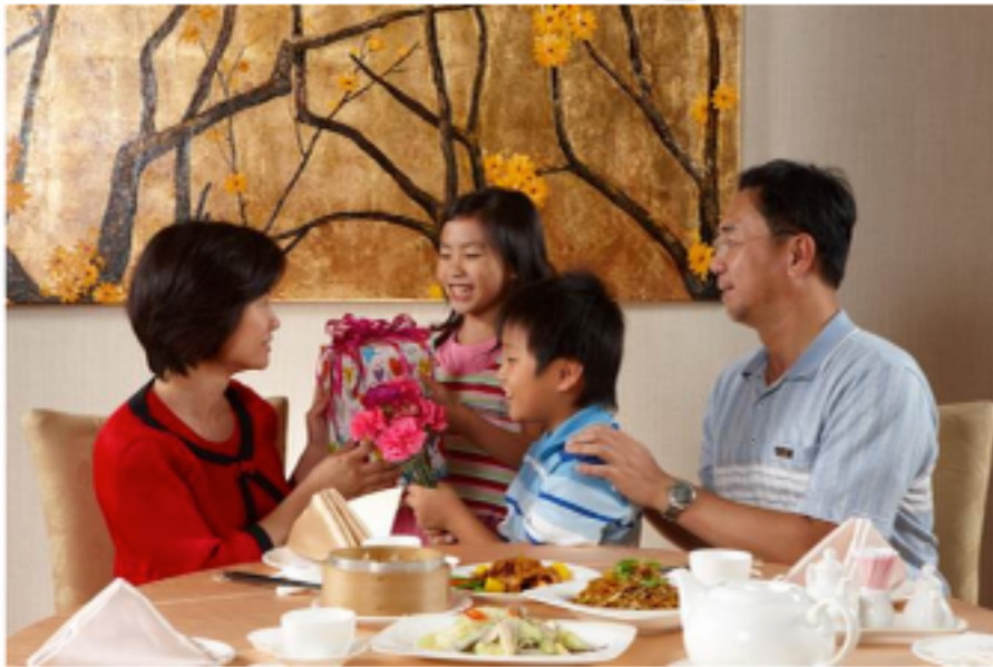
伴隨母親節的到來，高雄各大飯店紛紛推出打折等優惠措施搶客。

母親節到來 高雄各大飯店傳出訂餐熱潮 https://goo.gl/XTZZzy