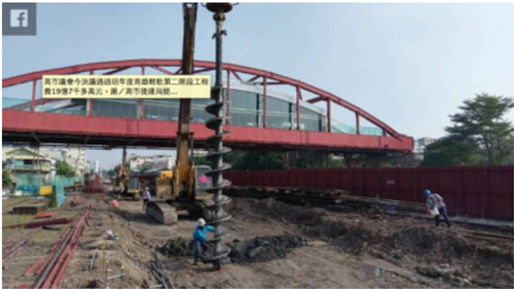
高市議會今決議通過明年度高雄輕軌第二階段工程費19億7千多萬元。

高市議會今決議通過明年度高雄輕軌第二階段工程費19億7千多萬元，捷運局長吳義隆表示，第二階段C14到17段持續鋪軌中，美術館路、大順路等指標路段，則需等待交通維持計畫審議通過後進場施工，施工時間預估在明年第一季。