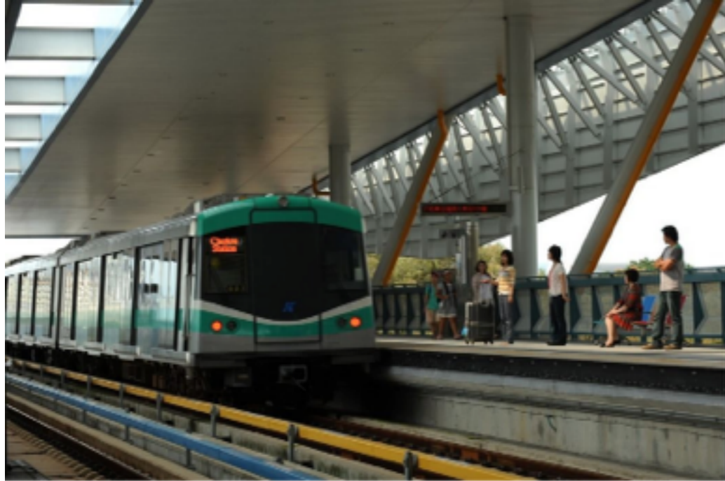
高捷首提撥盈餘4,000萬元回饋市府。

高雄捷運營運將進入第10年，高捷總經理賀新今天指出，初估將依約提撥4,000萬元盈餘回饋金給市府，是高捷首次回饋市府。